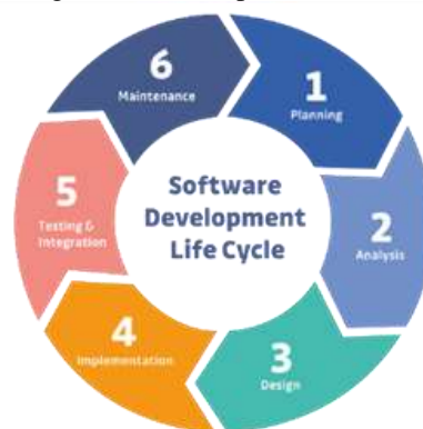
Gambar 1. Metode SDLC

Setelah selesai tahap implementasi dan pengujian, dilanjutkan dengan tahap pemeliharaan yang bertujuan untuk menjaga kelancaran operasional sistem. Proses ini melibatkan identifikasi masalah potensial yang mungkin muncul dalam penggunaan sistem, serta pembaruan keamanan secara berkala guna memastikan perlindungan terhadap sistem dari ancaman yang mungkin muncul. Selain itu, tahap pemeliharaan juga mencakup peningkatan fungsionalitas sistem sesuai dengan perubahan kebutuhan yang terjadi dari waktu ke waktu. Penting untuk diingat bahwa pemeliharaan sistem tidak hanya bersifat korektif terhadap masalah yang muncul, tetapi juga proaktif dalam menjaga sistem tetap relevan dan efektif dalam mendukung operasi bisnis. Dengan menjalankan tahap pemeliharaan secara teratur dan sistematis, diharapkan sistem informasi pendataan penjualan donat dapat tetap berjalan dengan baik dan dapat memenuhi tuntutan bisnis yang terus berkembang.