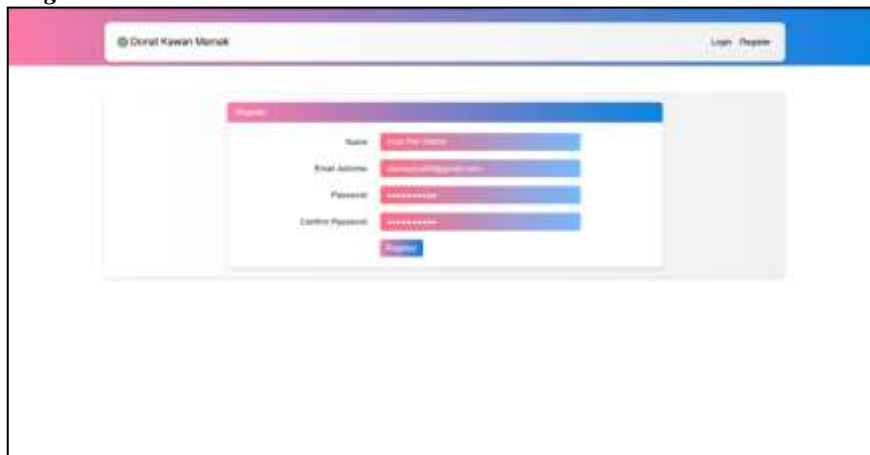
Gambar 6. Halaman Register

Gambar 6 menampilkan halaman registrasi dari Donat Kawan Mamak, dengan konsep yang serupa dengan halaman login, menghadirkan nuansa ceria dan mengundang dengan latar belakang berwarna ungu dan pink yang harmonis. Desain form registrasi yang simpel dan mudah diisi terintegrasi dengan baik dalam halaman, memungkinkan pengguna untuk dengan cepat memasukkan informasi dasar seperti nama, email, password, dan konfirmasi password untuk membuat akun baru. Tombol "Register" yang mencolok memberikan dorongan positif kepada pengguna untuk segera bergabung. Keseluruhan desain yang atraktif ini menciptakan pengalaman pengguna yang menyenangkan dalam proses registrasi, meningkatkan daya tarik dan keterlibatan pengguna dalam aplikasi tersebut.