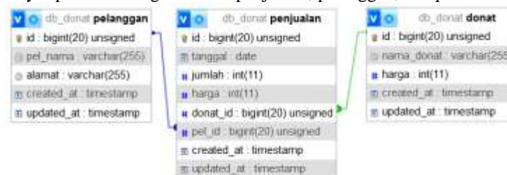
Gambar 2. Relasi Database

Dibawah ini terdapat relasi database yang memvisualisasikan interaksi antar ketiga tabel dalam sistem Pendataan Penjualan Donat Kawan Mamak Berbasis Web. Tabel-tabel tersebut saling terhubung dan berinteraksi untuk menyimpan dan mengelola data penjualan, pelanggan, dan produk donat.