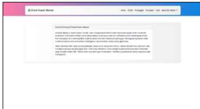
Gambar 7. Halaman Dashboard

Gambar 7 menampilkan halaman dashboard, sebuah antarmuka visual yang menyajikan informasi secara ringkas dan terpusat dari berbagai sumber data. Tujuannya adalah memudahkan pengguna dalam memantau, menganalisis, dan mengambil keputusan yang terinformasi. Desain yang intuitif dan interaktif memungkinkan pengguna untuk merespons informasi dengan cepat, sementara integrasi dengan data real-time meningkatkan akurasi dan ketepatan waktu. Halaman dashboard adalah alat penting dalam mendukung pengambilan keputusan efektif di berbagai bidang, menawarkan visibilitas yang luas dan akses mudah ke informasi yang relevan untuk aktivitas bisnis atau pengelolaan lainnya.