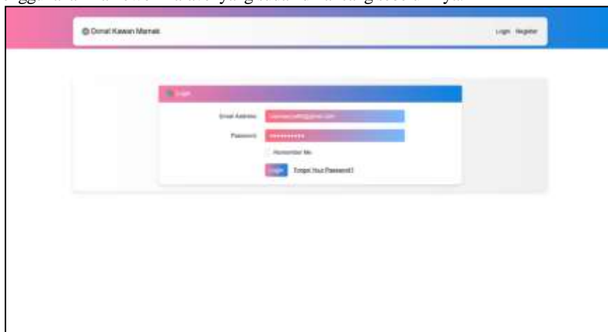
Gambar 5. Halaman Login

Berikut adalah tampilan desain dari web sistem informasi pendataan penjualan donat kawan mamak berbasis web dengan menggunakan framework laravel yang sudah di rancang sebelumnya.